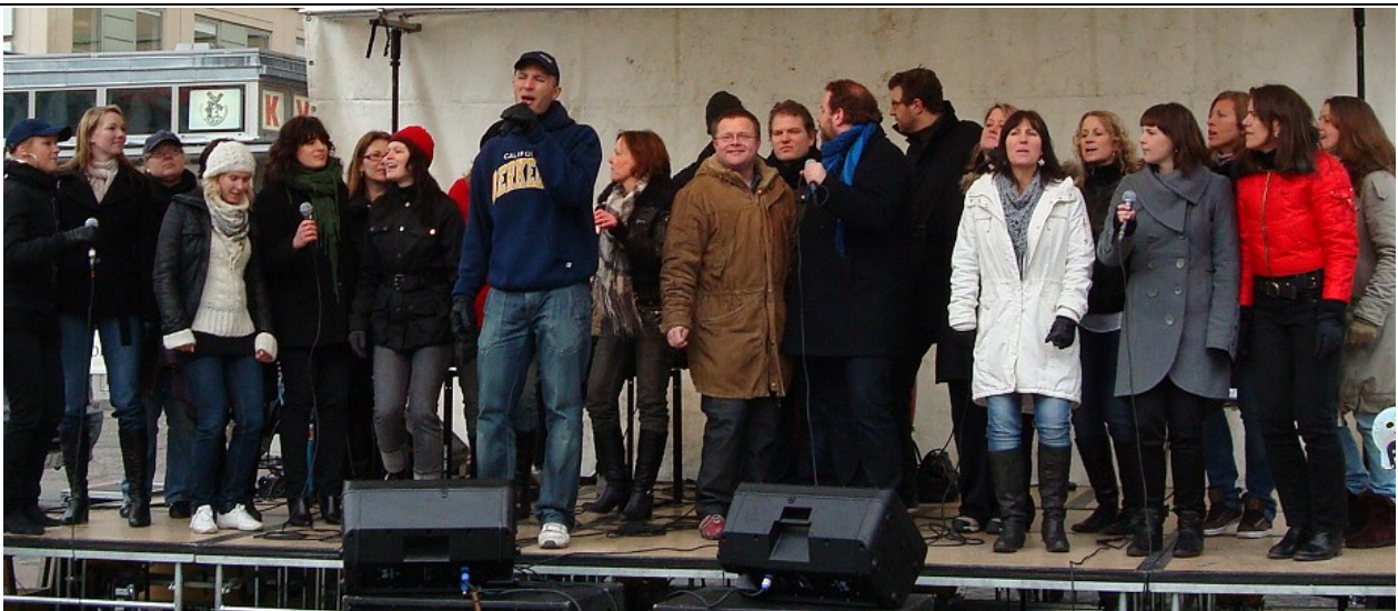
Immanuel gospel uppträder i stöd för kampen mot trafficking

Inga Johansson inga.johansson@missionskyrkan.se